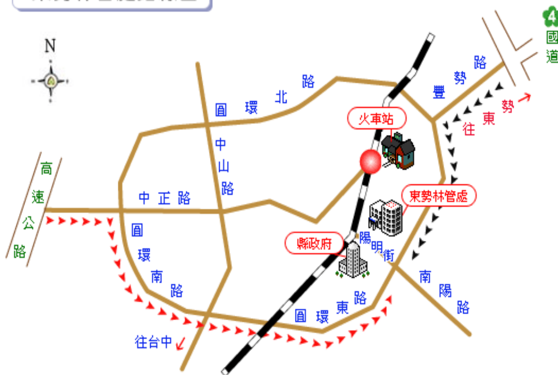
東勢林管處路線圖